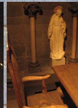
Vaka gjev rom for ettertanke og bøn