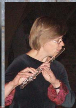
Fløytespel tonar inn kvar del av vigilien